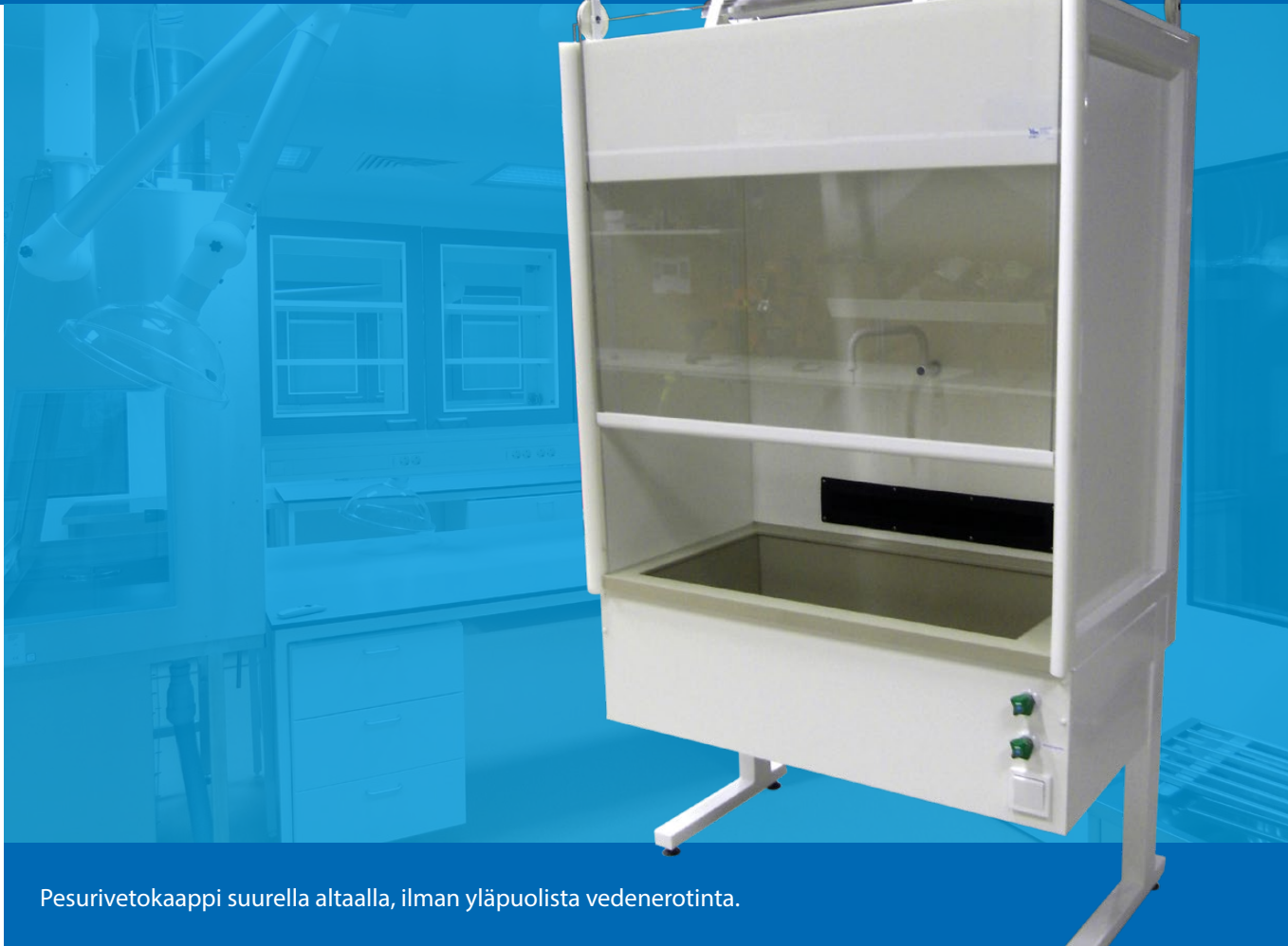
Pesurivetokaappi suurella altaalla, ilman yläpuolista vedenerotinta.